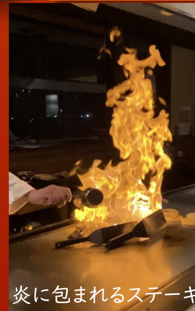
炎に包まれるステーキ