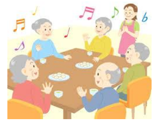
人と積極的に交流する

症状が軽い段階のうちに認知症であることに気づき、適切な治療が受けられれば、薬で認知症の進行を遅らせたり、症状を改善したりすることもできます。「もしかして認知症かも？」と思われたら、一人で悩まず専門家などに相談しましょう。