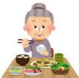
バランスの良い食事

生活習慣病（高血圧症、脂質異常症、糖尿病、心臓病など）を予防することは、認知症の予防にもつながります。